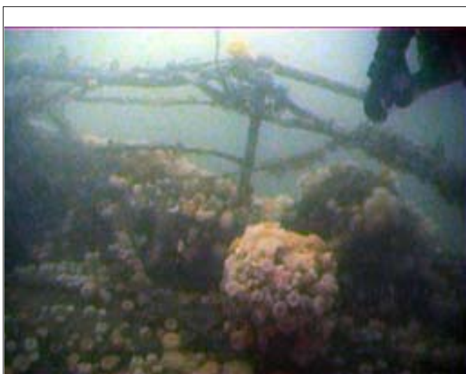
Rækværk på stævnen af Buenos Aires