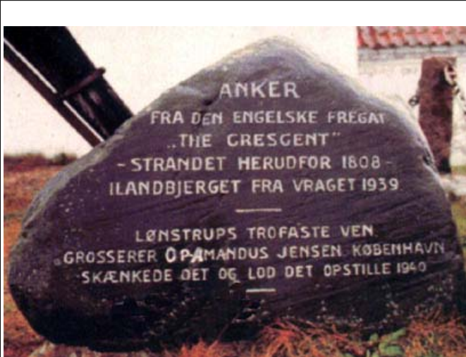
Opfisket anker og mindesten står i dag ved Mårup Kirke

Ude paa Fregatten forsøgte man at skyde sig flot. De svære Rystelser, som et helt Batteri paa een Gang afskudte Kanoner forvoldte, haabede man vilde ryste Skibet klar af Grunden; og nu skød Englænderne ind mod Land det glatte Lag, saa det drønedede gennem Storm og Sø og gav Genlyd i Klitterne.