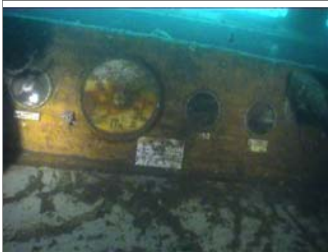
Instrumenter på Faros.