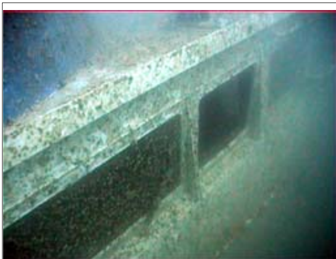
Styrhusvinduer på Faros.