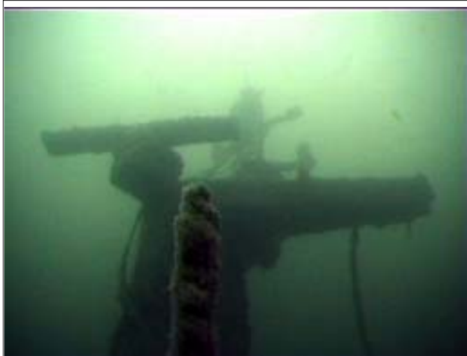
Faros mastetop.