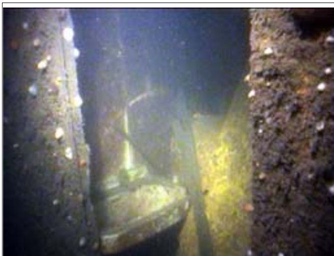
Sydfjord, håndvask